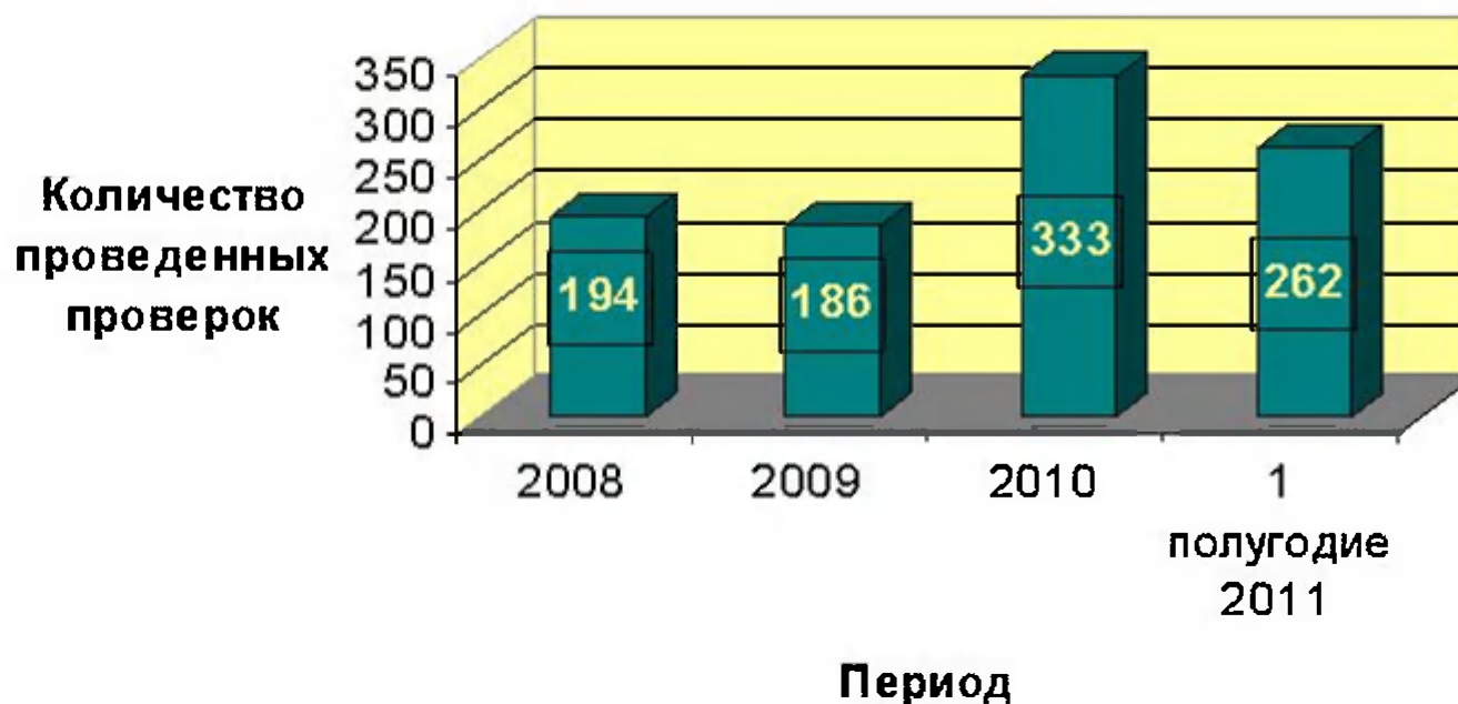
Динамика проведенных проверок за период 2008 - 1 полугодие 2011 года

ФЗ от 21.07.2005 № 94-ФЗ «О размещении заказов на поставку товаров, выполнение работ, оказание услуг для государственных и муниципальных нужд»