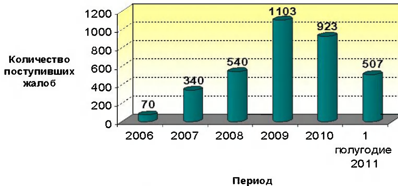
Динамика поступления жалоб за период 2006 - 1 полугодие 2011 года

ФЗ от 21.07.2005 № 94-ФЗ «О размещении заказов на поставку товаров, выполнение работ, оказание услуг для государственных и муниципальных нужд»