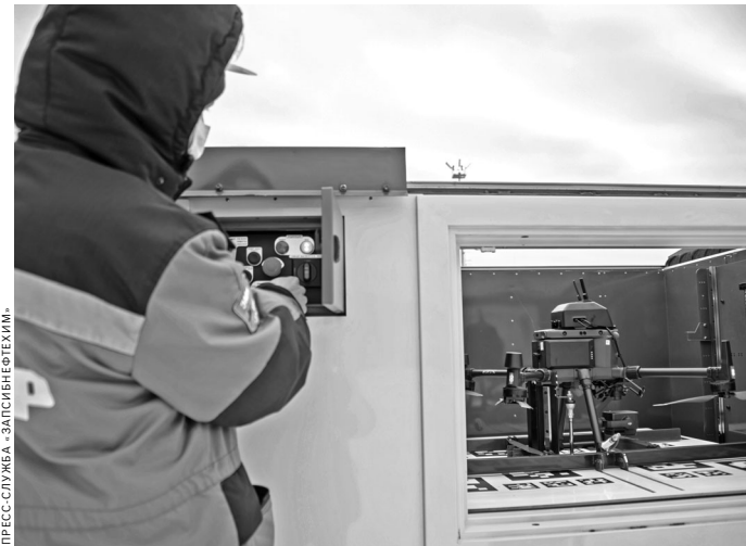
Беспилотник приземляется на специальную платформу, которая перемещает его в бокс, где аккумулятор заменяется на заряженный, а информация с флеш-карты скидывается в блок памяти.

и регулированию использования объектов животного мира подобным образом «охотятся» на браконьеров, черных лесорубов. Случается, и ночью. В прошлом году выявлено около трех десят-